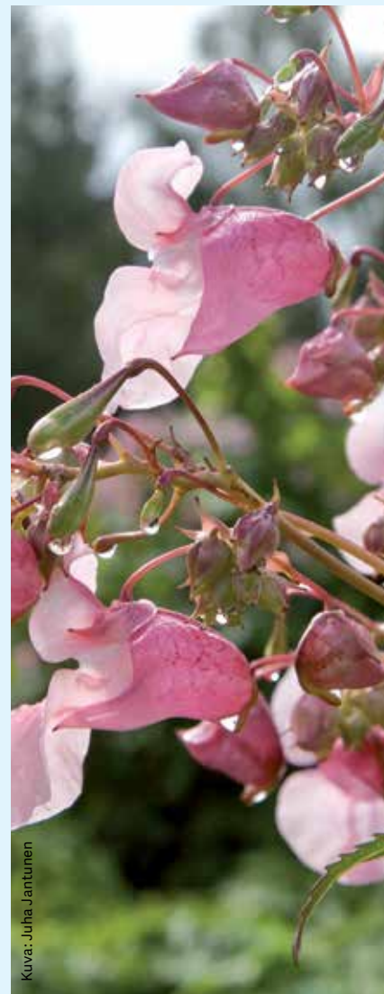
Kuva: Juha Jantunen

Jättipalsamilla on kauniit suuret kukat, mutta se on helposti leviävä haitallinen vieraslaji. Se muodostaa tiheitä kasvustoja, valtaa alaa alkuperäisiltä kasvilajeilta sekä vähentää esimerkiksi maassa elävien hyönteisten ja muiden selkärangattomien lajimääriä, mikä voi johtaa lajisuhteiden muuttumisen kautta kielteisiin muutoksiin kokonaisten ekosysteemien toiminnassa.