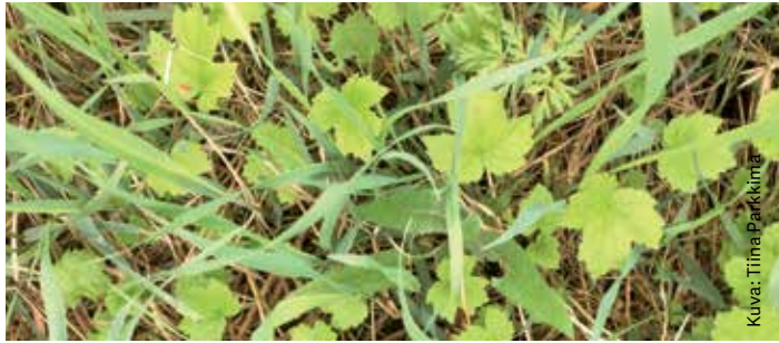
Maasta puskevat nuoret jättiputken lehdet muistuttavat muodoltaan minikokoisia vaahteranlehtiä.